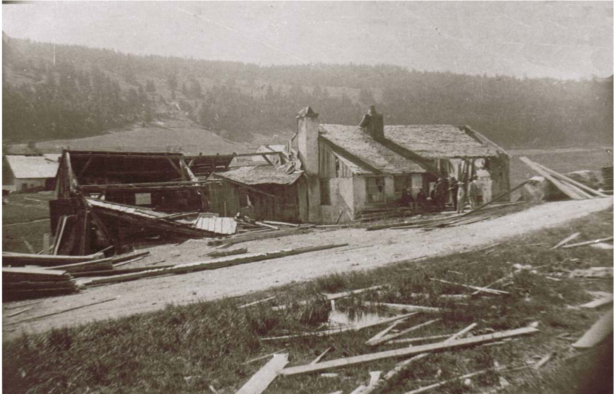
Façade occidentale. Si la maison a bien résisté, la scierie, par contre, en matériaux plus léger, a connu une dévastation fort conséquente.